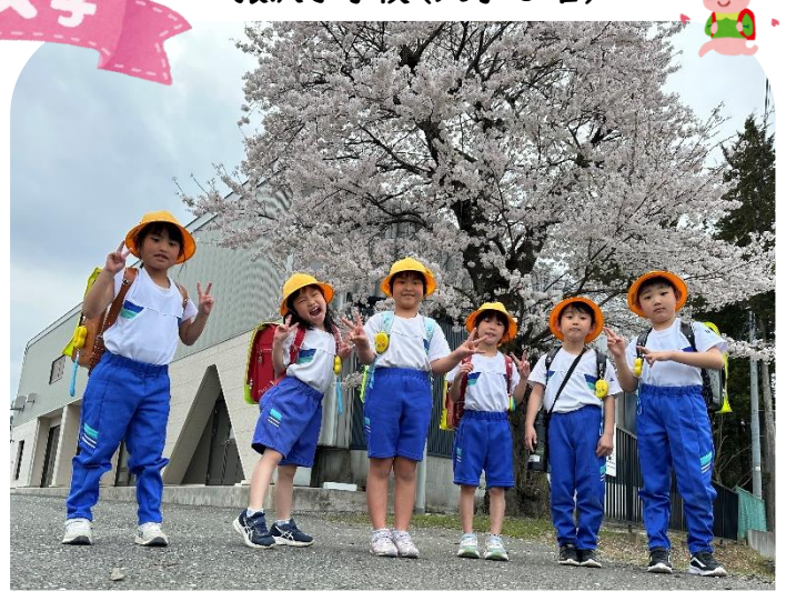
猿沢小学校(入学6名)