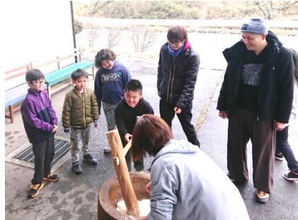
おいしいお餅もつきました☆