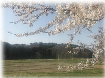
撮影地：台ヶ丘遊園地入り口