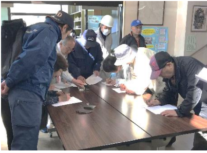
避難者の受入れ訓練の様子

4月28日(日)春季消防連合演習に合わせて、猿沢地区の各地区自主防災組織と猿沢市民センター職員が、震度6弱の地震の発生を想定し、避難所設置訓練を行いました。 一関北消防署の職員による指導を受け、災害発生時の避難所運営の全体的なイメージを把握し、模擬避難所運営委員会の設置、運営の訓練を受けました。 猿沢市民センターは、地域避難所に指定されています。また、FMあすもでは、避難所や災害の状況などの情報が入手できます。 いづどんな災害に見舞われるかわからないからこそ、災害備えを見直す機会にしてみたいかがでしようか。