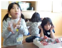
お手玉で遊ぶ児童