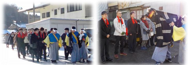
(H4年度卒業生)平成30年1月1日の行列の様子です。