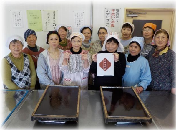
ご協力いただいている羊羹チームの皆さん

3月6日、第1回の試作研究会を行ってから1か月が経ちました。不明確な分量を明確にするため、文化祭のお弁当販売に携わっているご婦人方と、まちづくり委員数名にボランティアで協力していただき、4月6日(木)4回目の試作を行いました。 前回までは、毎回分量を変えた2〜3種類の羊羹を作り、理事会やまちづくり委員会で試食していただき、その都度アンケートをとり、それをもとに改良を重ね、試行錯誤を繰り返し、今回、9日に開催された猿沢婦人会の総会で大試食会を行いました。