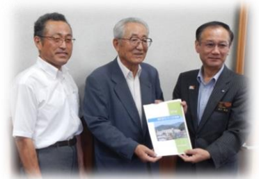
7/29に大東支所長(写真右)へ計画書を提出しました

今後は、この計画を基として地区の皆さんの参加と協力をいただきながら事業を進めて参ります。