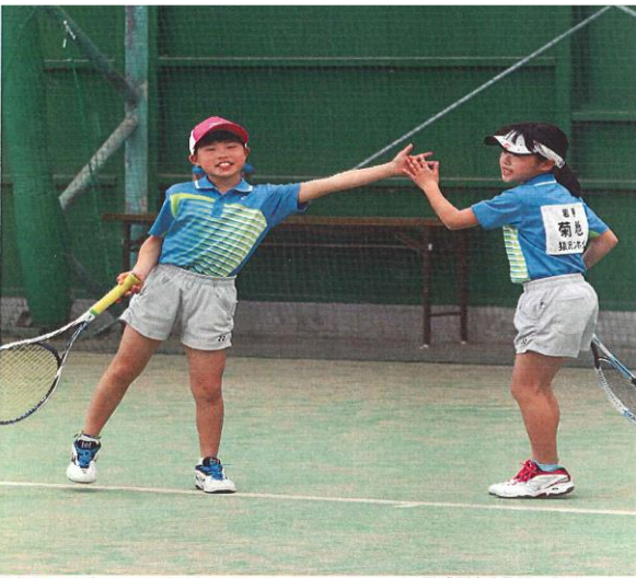
第15回全国小学生ソフトテニス大会 平成28年3月30・31日 千葉県白子町 A2207