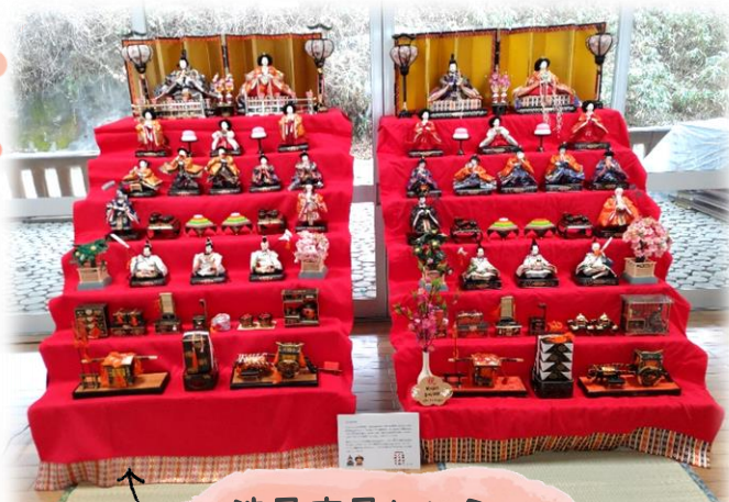
渋民市民センター

猿沢地区の、峠のひな祭りや、ふれあい交流館「なに〜か・あ〜る」でも、ひな祭りを開催しました。開催の様子は振興会だよりをご覧ください♪