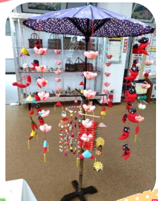
興田市民センター