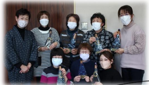
受講生7名で夢中になって縫いました(笑)