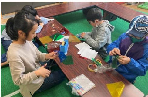
↑作り方の説明ができるように試作に取り組み様子