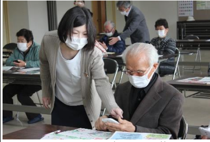
スマホ操作を学ぶ受講生