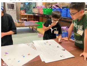
←ポスター制作をする5年生

放課後子ども教室の5年生が中心となって子ども教室のみんなが楽しめる工作教室の企画・運営に挑戦しました。 今回は「ペットボトルのランプシェードづくり」を企画し、周知ポスターを作成したり、試作をして工程を覚えたりと遊びの時間を割いて工作教室の準備をしました。 当日は、5年生が作り方の説明を行い、他学年のサポートをし、みんなで楽しい工作教室を行うことができました。 工作教室の翌日には、「ランプシェード観賞会」を行い、暗くした室内に輝く子どもたちのランプシェードがともきれいでした。 5年生の皆さんはとても立派なリーダーでした。お疲れ様でした。