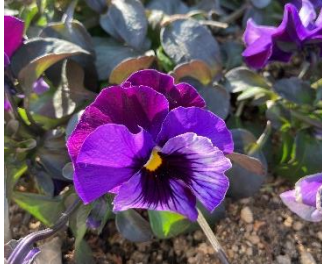
↑ピオラ (ご近所さんの花壇)