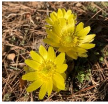
←福寿草 (市民センター)