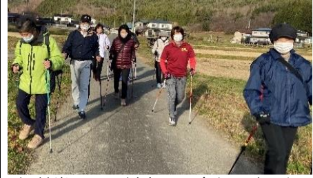
伊勢堂・野田前方面へ向かいました