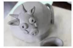
来年の干支「丑」の作品

11月11日 (水)第3回目 の陶芸教室を 開催しまし た。今回は 「干支マスコ ットづくり」 来年の干支の