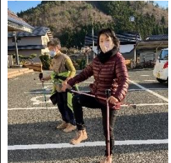
ポールを使った筋トレ これが結構効きます！