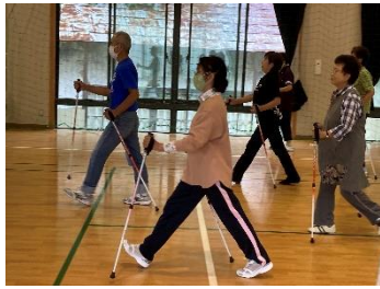
背筋が伸びた美しい姿勢で歩く受講生