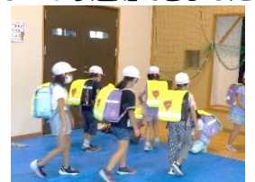
真剣なムードで訓練

9月15日(火)、猿沢保育園・猿沢小学校・猿沢市民センターの合同避難訓練を行いました。