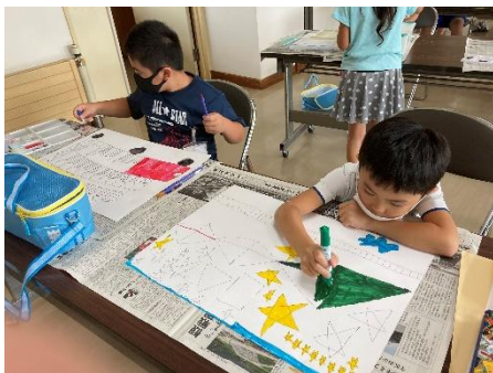
画用紙いっぱい絵を描く子どもたち

制作した絵画は、「わたしたちのふるさと」「一関」絵画「コンクール」と「車」に描く未来のまちづくり絵画「コンクール」へ出品します。