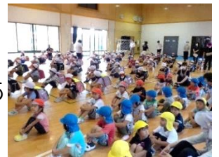
しっかり避難できました