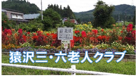
猿沢三・六老人クラブ