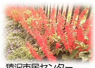
猿沢市民センター

猿沢市民センターも「奨励賞」を受賞しました。花植えや草取りと、地区の皆様がたくさんのご協力をいただきました。この場をおかりして御礼申し上げます。ありがとうございました☆